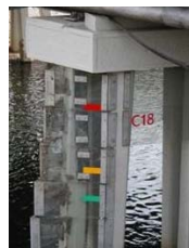
Značky na mostním pilíři